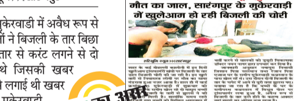
खबर का अंश