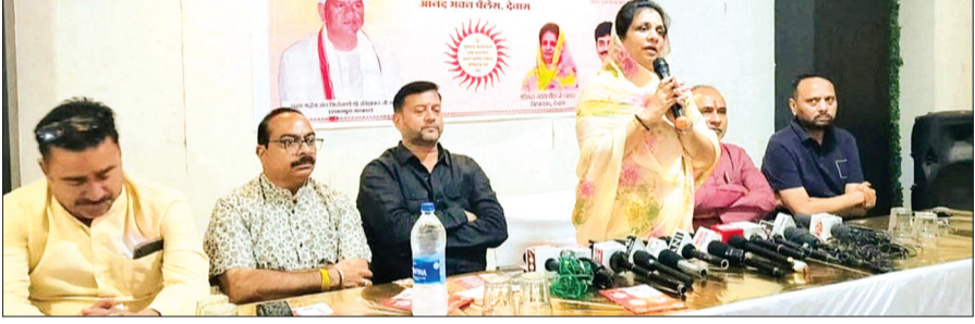
हरिभूमि न्यूज ▶ देवास