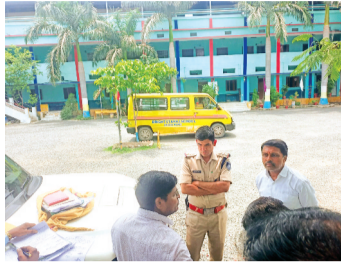
द्वारा स्कूली बसों एवं वाहनों के कागजात को चेक किया गया, साथ ही बसों के चालकों-परिचालकों का चरित्र सत्यापन एवं ब्रेथ एनालाइजर द्वारा परीक्षण किया गया।

जिले में बिना परमिट के स्कूल वाहन सड़कों पर दौड़ रहे हैं। इनमें टूंस-टूंस कर बच्चों को बैठाया जाता है। गत दिवस एक वेन हादसे का शिकार हो गई थी। ग्रामीण क्षेत्रों में स्कूली बच्चों के वाहन बगैर फिटनेस सहित परमिट के चल रहे वाहनों की जांच को लेकर आरटीओ सहित यातायात विभाग द्वारा संयुक्त कार्यवाही की जा रही है। शुक्रवार को जिले के अकोदिया में संयुक्त टीम कार्यवाही करने निजी स्कूलों में पहुंची। जहां पर स्कूल प्रबंधन के समक्ष ही वाहनों की जांच शुरू की गई। वहीं विभिन्न शैक्षणिक संस्थाओं के 30 से अधिक वाहनों को चेक किया। चेकिंग के दौरान बिना फिटनेस बिना परमिट वाहनों को जब्त करने की कार्यवाही की गई। 7 वाहनों को अलग-अलग स्कूलों से जब्त किया और 15 हजार का शुल्क वसूला। अग्निशमन यंत्र, फर्स्ट एड बॉक्स, पैनिंग बटन, स्पीड गवर्नर, सेफ्टी विंडो रॉलिंग, आपात निकासी द्वार को चेक किया गया। यातायात पुलिस