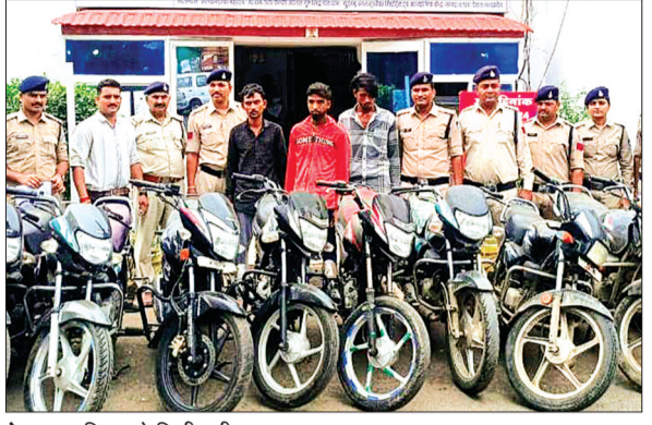
देवास। पुलिस को मिली बड़ी सफलता।

औद्योगिक थाना पुलिस ने वाहन चोरों पर नकेल कसने के लिए विशेष टीम का गठन किया, लगातार जारी रहती है आरोपियों की तलाश।